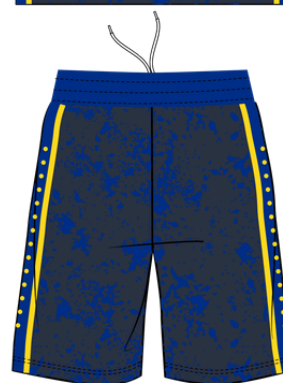
tenue de match extérieur