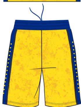
tenue de match domicile